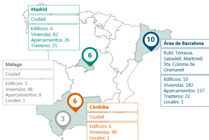
Cartera de ADVERO por número de edificios (1)

(1) Incluye el edificio adquirido en Madrid en febrero de 2024